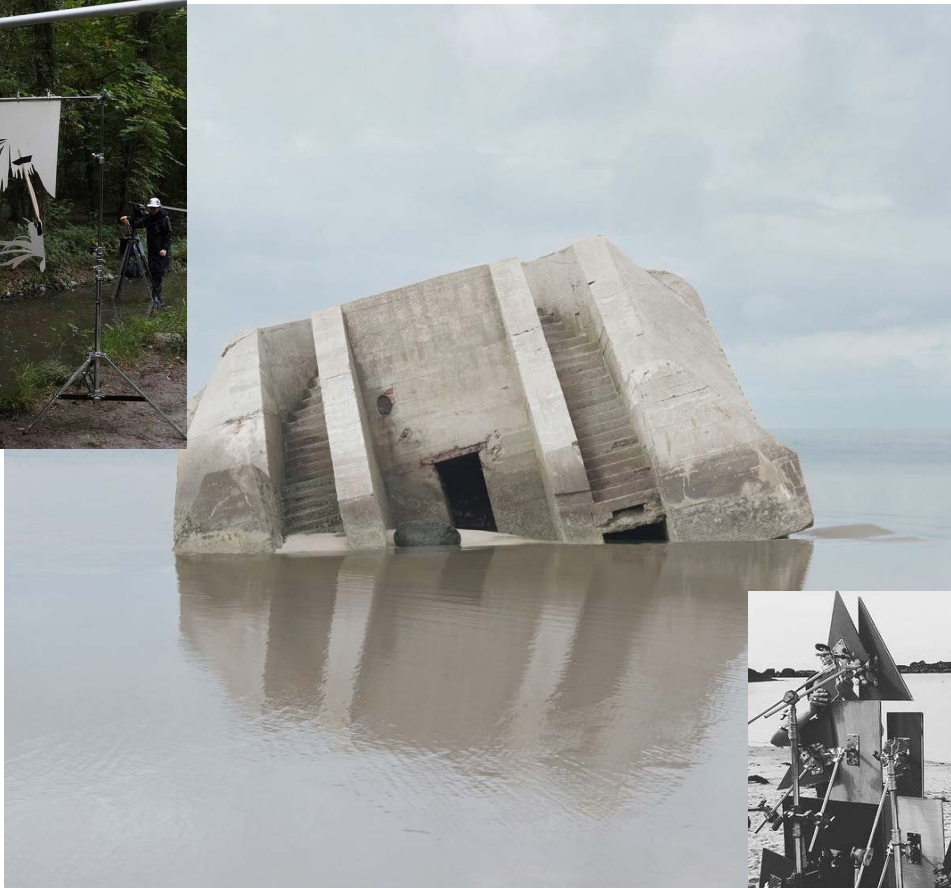
^ Noémie Goudal, Combat , 2012