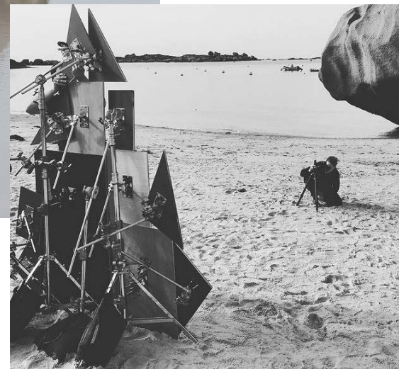
v Noémie Goudal, Installation et prise de vue en Bretagne, 2017

Se questionner : Une œuvre peut-elle être à la fois un document et une fiction ?