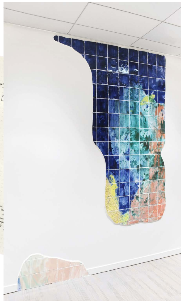
> Côme Clérino, Fenêtre carrelée , 2020

Se questionner : Qu'y a-t'il d'artistique dans les objets du quotidien ?