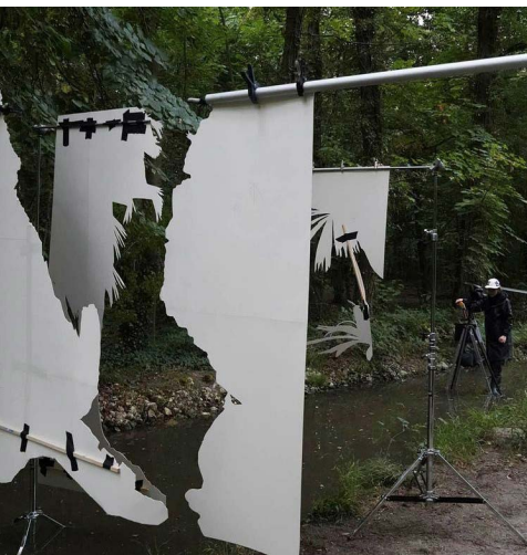
Noémie Goudal, Installation et prise de vue au Bois de Vincennes, 2020

• Mots-clés : paysage - documentaire - montage - fiction - réalité •