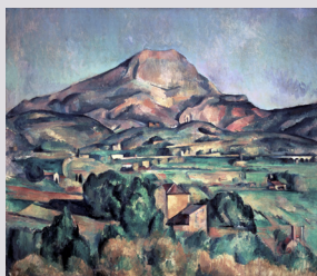
< Paul Cézanne, La Montagne Sainte-Victoire vue de Bellevue, 1885

• mots-clés : paysage, espace, environnement, déplacement •