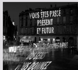
< Jenny Holzer Montréal, 2020

• mots-clés : document, mémoire, temps court et temps long •