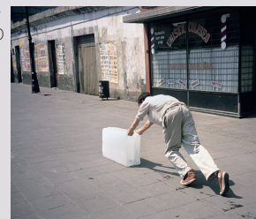
Francis Alÿs > Sometimes Making Something Leads To Nothing, 1997