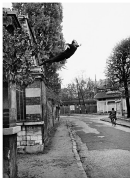
< Yves Klein Le peintre de l'espace se jette dans le vide, 1960

• mots-clés : sensation, vision, caché, énigme •