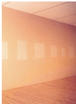
Ignasi Aballí > Colección pública, 1994

Penser ensemble à : une œuvre invisible.