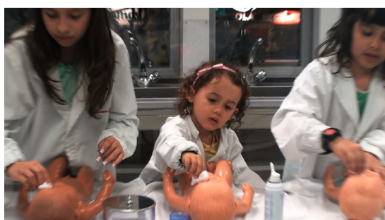
Priscila Fernandes For a Better World [Pour un monde meilleur], 2012

Vidéo projection, 16:9, couleur, son, 8 mn 19 sec