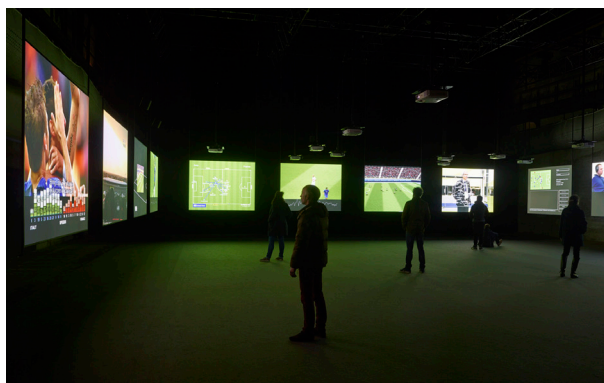
Harun Farocki, Deep Play , 2007, exposition au LiFE 2017 FNAC 10-1108, collection du Centre national des arts plastiques