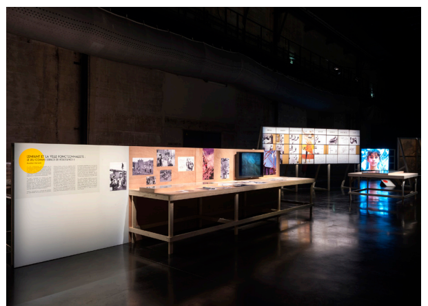
Vues de l'exposition Les enfants d'abord ! Production LiFE – Ville de Saint-Nazaire, programmation hors les murs du Grand Café – centre d'art contemporain, Saint-Nazaire, 2018