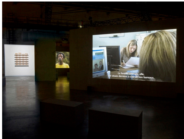
Vue de l'exposition Par les temps qui courent , LiFE – Grand Café – Saint-Nazaire, 2013

Dans ses murs, Le Grand Café développe un projet international fortement articulé avec la ville de Saint-Nazaire, véritable terrain d'expérimentation artistique. Sa programmation prend appui sur les dynamiques d'un territoire riche, en transformation où se mêlent à la fois histoire industrielle et sociale, contemporanéité et héritage de la modernité, horizon maritime et imaginaire du voyage. Toute l'année, il présente des expositions d'artistes nationaux et internationaux qui révèlent au public un travail de prospection et de production. Les expositions monographiques sont la marque de fabrique du centre d'art. Véritable soutien à la création, elles sont l'occasion d'un important travail de production d'œuvres nouvelles qui croisent recherches artistiques et expérience du lieu ou de la ville. Les artistes étrangers y font souvent leur première exposition personnelle en France et les artistes français y créent fréquemment des œuvres significatives de leur parcours. Une attention particulière est portée aux scènes d'Amérique latine.