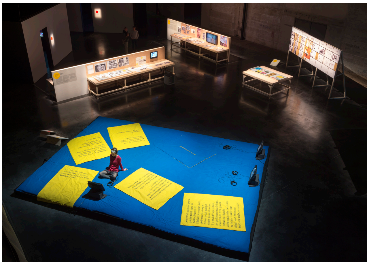
Vue de l'exposition Les enfants d'abord !

L'œuvre s'inscrit dans le cadre de la résidence [co-] que l'artiste mène au CAC Brétigny.