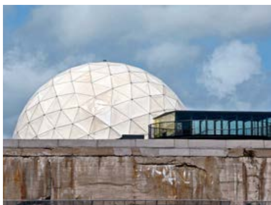
Radôme, base des sous-marins de Saint-Nazaire, 2015

Ouvert tous les samedis et dimanches du 6 juillet au 25 août, et les 21 et 22 septembre de 15:00 à 19:00 Entrée libre.