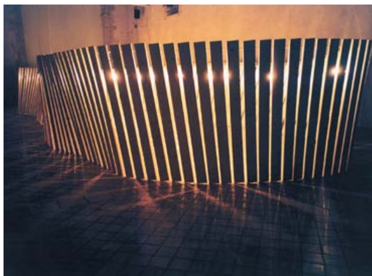
Claude Lévêque Boomerang , 2003 Dispositif in situ , chapelle du Genêteil, Château-Gontier Palissade close de planches, lampes avec effet chenillard Diffusion sonore, claquement aléatoire en écho Conception sonore en collaboration avec Gerome Nox Photo Claude Lévêque © ADAGP Claude Lévêque. Courtesy the artist and kamel mennour, Paris

2 - Une vision dont est dotée la créature de super-vilain créée par Marvel Comics, le Human Fly éponyme, qui est au cœur des paroles de la chanson.