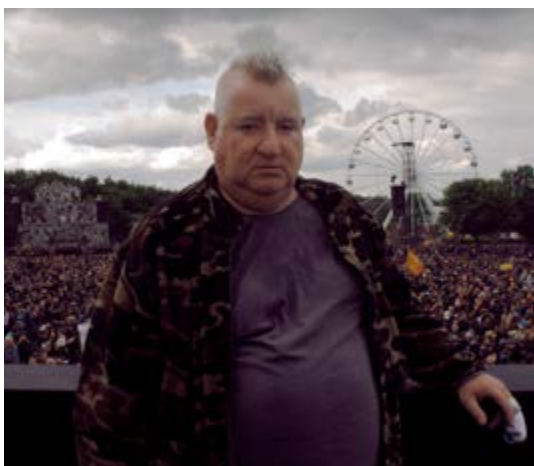
Claude Lévêque au Hellfest