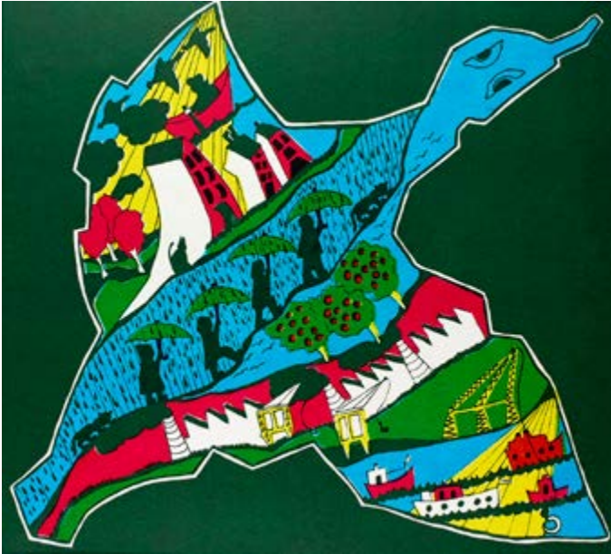
Le Canard qui volait contre le vent, affiche sérigraphiée, La Tribu, Saint- Nazaire, 1976