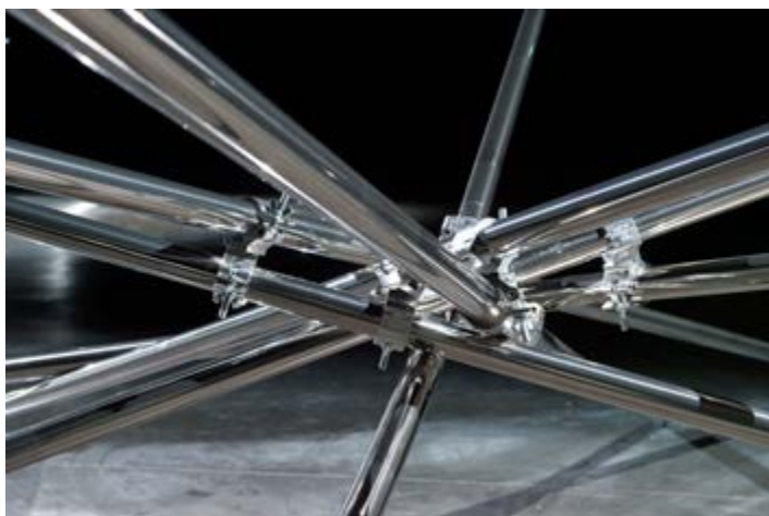
Claude Lévêque, Human Fly , 2019 Dispositif in situ , LiFE, Saint-Nazaire Tubes inox poli miroir, projecteurs asservis. Diffusion sonore : roulements et claquements métalliques Conception sonore en collaboration avec Yoann Le Claire Photographie Marc Damage © ADAGP, Paris Courtesy the artist and kamel mennour, Paris/London