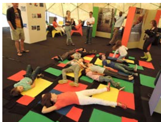
Atelier famille au Radôme, autour de l'exposition Des Volumes et des vides au LiFE, Krijn de Koning, été 2018

Gratuit, sur réservation dans la limite des places disponibles. Programme disponible sur le site internet du Grand Café.