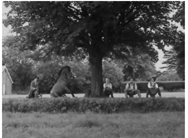
COURT N°4, 2014 Vidéo noir et blanc Courtesy de l'artiste et galerie Xippas, Paris © Bertille Bak